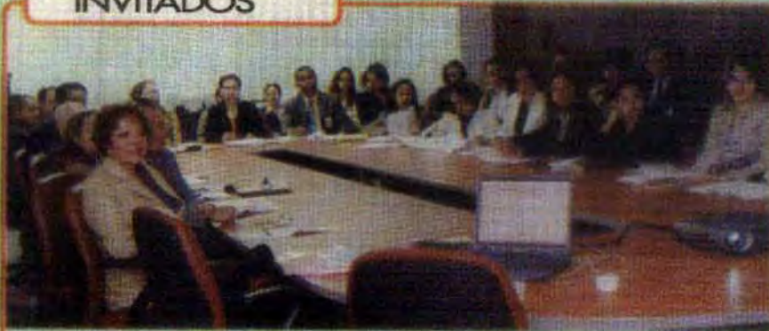
Público Asistente en la Jornada de Capacitación, en el salón de conferencias de Industria y Comercio.