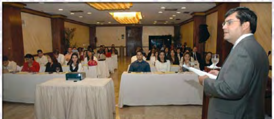
Parte del personal de ONAPI que participó en el seminario.