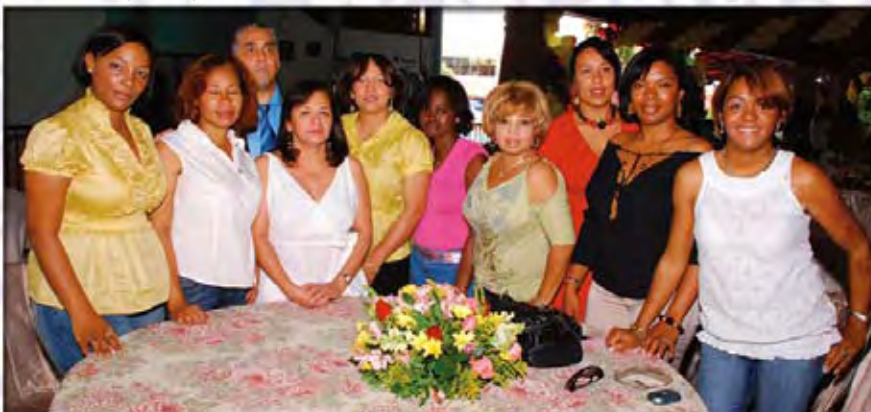
El equipo de Servicios al Cliente de Onapi disfrutó en grande de esta fiesta.