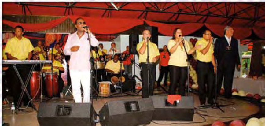
El salsero Sexappeal mientras amenizaba la fiesta junto a su orquesta.